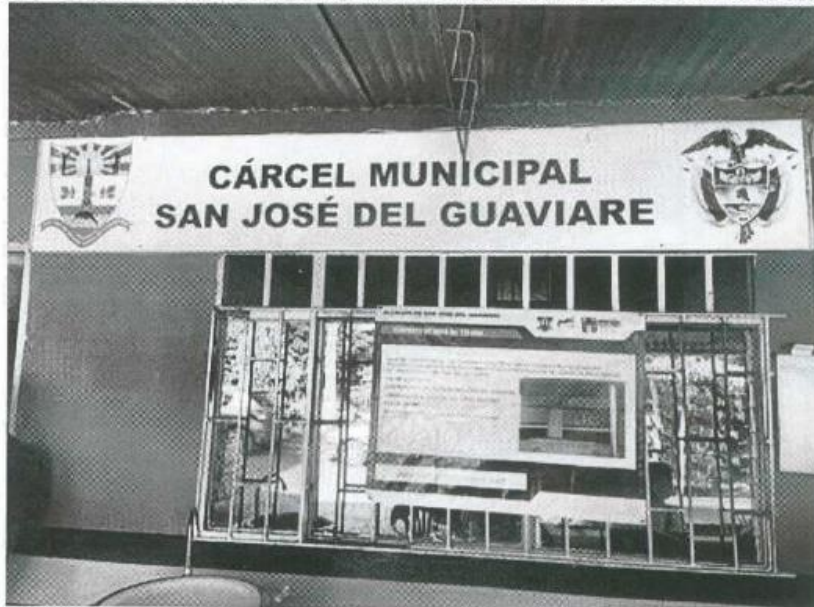
Imagen 1. Valla instalada contrato 174-2020.

ANEXO: REGISTRO FOTOGRÁFICO INSTALACIÓN DE VALLA CONTRATO DE OBRA 174 DE 2020